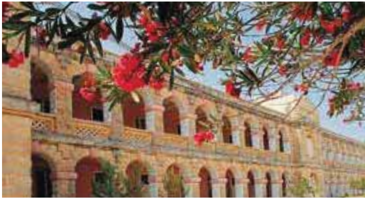
校舎はギリシャ建築を思わせるクラシカルで美しい石造りが印象的です。 【アパート外観】

4週間 1.320 EUR から スタンダードコース 滞在 入学金&宿泊手配料込