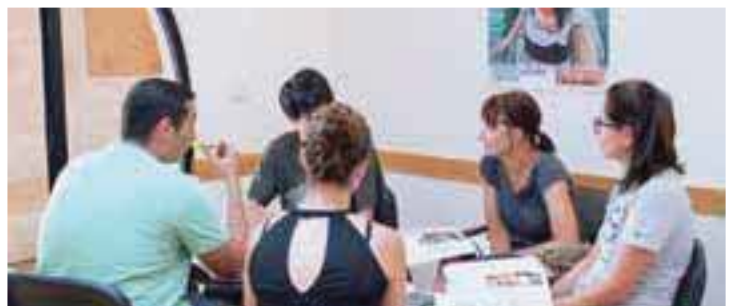
マルタのコースは最大10名の少人数クラス。会話中心の授業で実践力を身に付けましょう。開放的な環境で、様々な経験・友人との出逢いを大切に、あなたの個性を伸ばす留学にしましょう。【レッスン風景】

チェックイン時間 アパート: 12時以降 (レセプションは24時間対応。早朝、深夜のご到着の場合は事前にお問合せください。) ホームステイ: 22時まで(22時以降の場合は事前にお問い合わせください。)