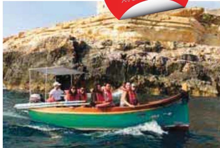
年間を通して陽光に恵まれ、リラクゼーションとレジャーの機会にも多く恵まれた島国マルタで、最高の留学体験を実現しましょう。