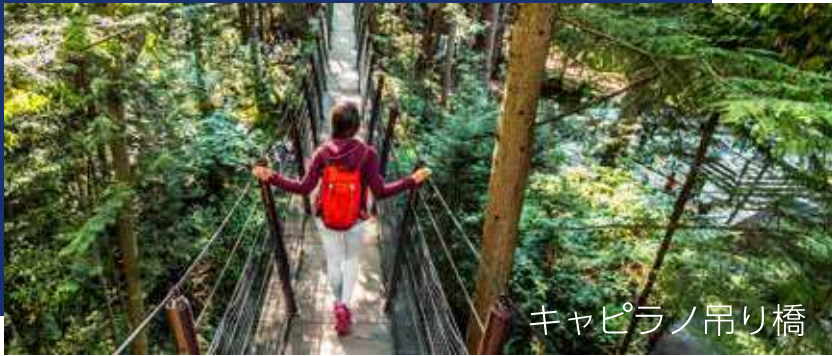
キャピラノ吊り橋

バンクーバーを満喫しながら楽しめる幅広い種類のアクティビティをご用意しています。