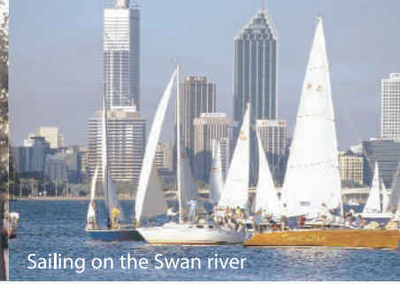
Sailing on the Swan river