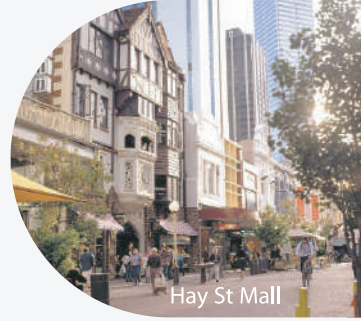
Hay St Mall