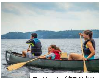
ロッセウ・レイクでのカヌー