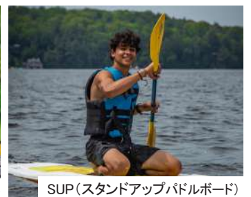
SUP(スタンドアップパドルボード)