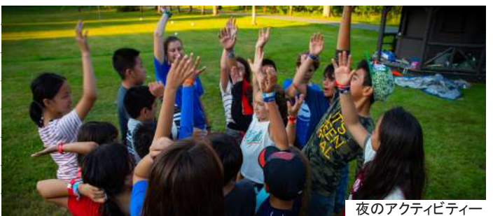
夜のアクティビティー